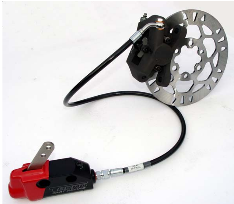
FOTO DEL SISTEMA FRENANTE COMPLETO PRESENTATO ALL'ATTO DELL'OMOLOGAZIONE

La presente scheda d'omologazione riproduce descrizioni, foto, illustrazioni e dimensioni dell'impianto frenante al momento dell'omologazione. L'impianto frenante deve rimanere originale di fabbrica, qualsiasi tipo di lavorazione atta a modificarne l'originalità è VIETATA