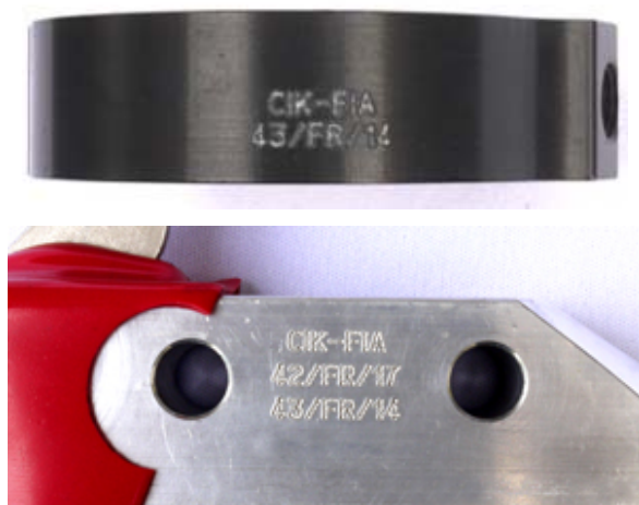
Maître-cylindre / Master-cylinder