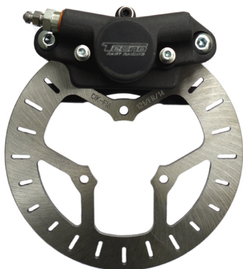
Photo du frein avant : étriers et disques seulement Photo of front brake: calipers and discs only