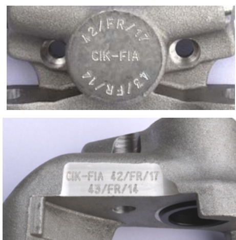
Etriers / Calipers