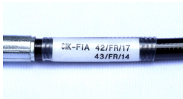
Tuyaux / Lines