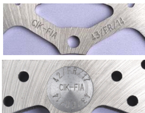
Disques / Discs