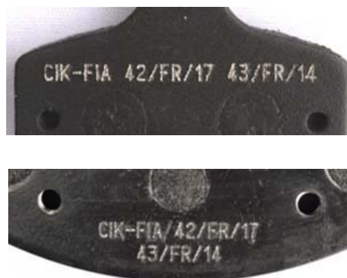
Plaquettes / Pads